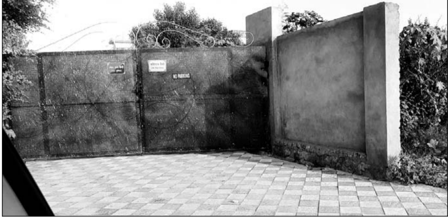
नांगल जैसा बोहरा गांव में खसरा नंबर 517/3 की आम रास्ते की जमीन पर खातेदारों द्वारा करीब 300 फीट से ज्यादा की दूरी में बाउंड्रीवाल बनाकर और लोहे के गेट लगाकर कब्जा कर लिया गया।

जे.डी.ए. प्रशासन ने नांगल जैसा बोहरा में करीब साढ़े 3 करोड़ की इस बेशकीमती भूमि से अतिक्रमण हटाना तो दूर एक माह बाद तक कलेक्टर को जवाब तक नहीं भिजवाया