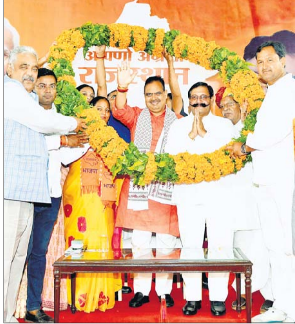
माटी कला को बजट घोषणाओं में विशेष प्रोत्साहन देने के लिए प्रजापत समाज ने मुख्यमंत्री भजनलाल शर्मा को माला पहनाकर धन्यवाद दिया। मुख्यमंत्री ने इस मौके पर आयोजित सभा में कहा कि राज्य सरकार दस्तकारों की कला को प्रोत्साहन देने के लिए अगले तीन साल में 50 क्लस्टर विकसित करने जा रही है।

शर्मा ने कहा कि पीएम विश्वकर्मा योजना के तहत 18 व्यवसायों के दस्तावेजों को 5 प्रतिशत की दर पर ऋण उपलब्ध कराया जा रहा है। राज्य सरकार ऐसे ऋणों पर 2 प्रतिशत का अतिरिक्त ब्याज अनुदान देगी। उन्होंने कहा कि रोजगार व नियमित को बढ़ाव देने के लिए एम.एस.एम.ई. पॉलिसी-2024 लायी जाएगी। हमारी सरकार ने उद्यमियों की