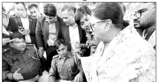
जानकारी मिलते ही वसुंधरा राजे घायल पुलिसकर्मीयों के पास पहुंची।

पाली, (नि.सं.)। पाली जिले में पूर्व मुख्यमंत्री वसुंधरा राजे के काफिले की एस्कोर्ट कर रही पुलिस की जीप पलट गई। हादसे में कुछ पुलिसकर्मी घायल हो गए, जिन्हें बाली के राजकीय अस्पताल में भर्ती कराया गया है।