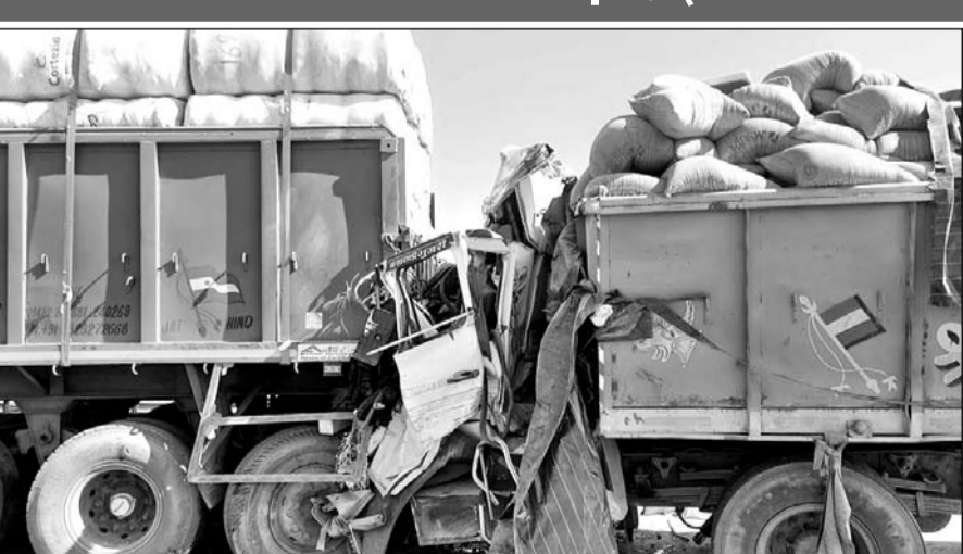
अजमेर-भीलवाड़ा हाईवे पर स्थित कोठारी नदी की पुलिया पर घने कोहरे से कई वाहन टकरा गए, इनमें एक यात्री बस भी शामिल है।

अजमेर-भीलवाड़ा हाईवे पर स्थित कोठारी नदी की पुलिया पर हादसा हुआ