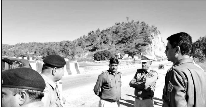
हादसे के बाद पुलिस मौके पर पहुंची और जानकारी जुटाई।

उदयपुर, (कास)। उदयपुर में बेकरिया थाना क्षेत्र के देवला चौकी से आगे पिण्डवाड़ा हाईवे पर शुक्रवार सुबह एक तेज रफ्तार ट्रैलर ने सवारी ऑटो को टक्कर मार दी। हादसे में ऑटो में सवार 5 सवारियों की मौत हो गयी। मृतकों में 2 वर्षीय बच्चा, उसकी मां सहित 3 अन्य महिलाएं शामिल हैं। वहीं 5 बच्चे और तीन महिलाओं सहित 8 सवारियां और ऑटो चालक घायल हो गये। हादसे