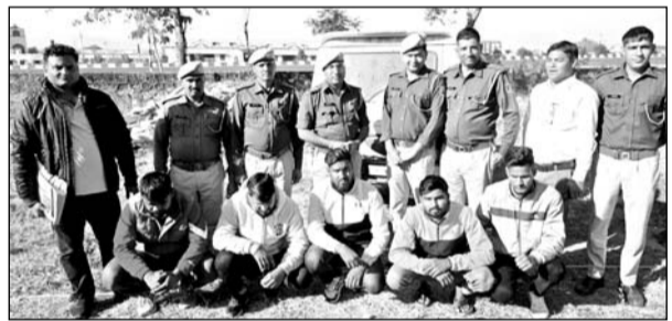
पुलिस ने हमला करने के आरोपियों को गिरफ्तार किया।