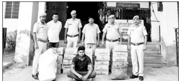
पुलिस ने अवैध शराब सहित एक जने को गिरफ्तार किया।

खेतड़ी, (निर्स)। खेतड़ी नगर पुलिस व जिला स्पेशल टीम ने क्षेत्र में अवैध शराब बेचने वालों के खिलाफ संयुक्त रूप से कार्रवाई करते हुए भारी मात्रा में अवैध अंग्रेजी व देशी शराब जब्त कर एक आरोपी को गिरफ्तार किया। आरोपी ने देवता से ढाणी बाढान जाने वाले रास्ते पर मुर्गा फार्म में एक अवैध शराब की गांज खोल रखी थी।