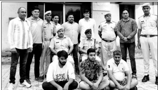
पुलिस ने हत्या के मुख्य आरोपियों को गिरफ्तार किया।