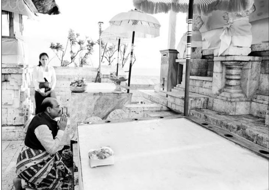
लोकसभा अध्यक्ष ओम बिरला ने बुधवार को बाली, इंडोनेशिया के उलुवातु मंदिर में पूजा अर्चना की।

प्रतिमा की अवधारणा और संकल्पना के बारे में जानकारी दी गई। बिरला को यह जानकारी खुशी हुई कि भारत की सांस्कृतिक उत्कृष्टता की झलक बाली में इतनी खूबसूरती से दर्शाई गयी है। उसके बाद प्रतिनिधिमंडल बाली के विश्व प्रसिद्ध उलुवातु मंदिर पहुंचा। यह मंदिर बाली के नौ प्रमुख डायरेक्शनल मंदिरों में से एक है। अद्भुत वास्तुकला से सुसज्जित, यह मंदिर एक अद्वितीय स्थान पर स्थित है जहां ऊपर बने बादल हैं और नीचे चट्टानों पर लहरें आकर टकराती हैं। बाद में, बिरला ने उलुवातु केकड डांस ओपन थिएटर, बाली में केकड नृत्य प्रदर्शन देखा। चूंकि यह नृत्य रामायण से प्रेरित है, इसलिए इससे विशेष रूप से भारतीय मूल के लोगों में गर्व की भावना उत्पन्न होती है कि भारत की समृद्ध संस्कृति इतने दूर-दूर तक के क्षेत्रों तक भी फैली हुई है।