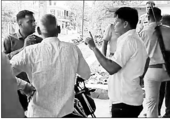
भुसावर पुलिस ने सीआईडी टीम को ग्रामीणों के चंगुल से छुड़वाया।

भुसावर, (निर्स)। भरतपुर जिले के भुसावर में शनिवार को सी.आई.डी. स्पेशल ब्रांच की टीम के साथ बंधक बनाकर मारपीट की गई। संदिग्ध आरोपी को पकड़ने सादा कपड़ों में पहुंची टीम को ग्रामीणों ने घेरकर हमला किया।