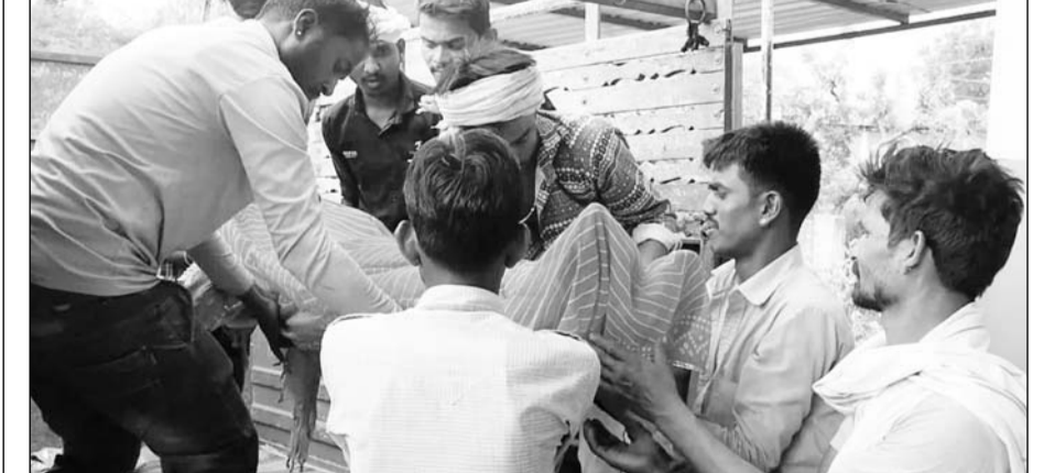
नहर में बालिकाओं की डूबने से मौत के बाद मौके पर एकत्रित भीड़ व पुलिस ने शवों को बाहर निकाला।