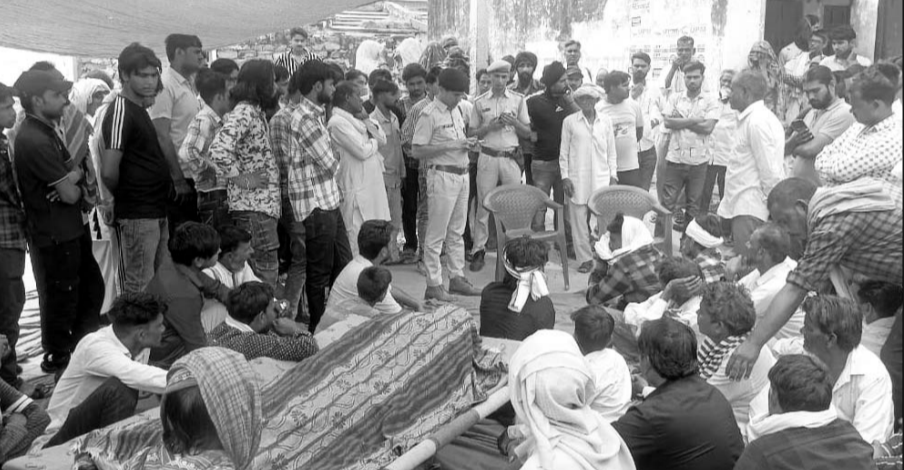
हत्या के बाद परिजन शव को लेकर धरने पर बैठ गए।

गिरफ्तारी की मांग को लेकर धरने पर बैठे ग्रामीण