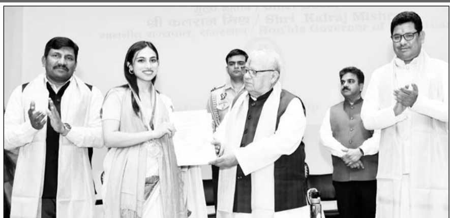
जोधपुर में राज्यपाल और कुलाधिपति कलराज मिश्र ने दीक्षांत समारोह को संबोधित किया।

जयपुर/जोधपुर, (कांस)। राज्यपाल और कुलाधिपति कलराज मिश्र ने कहा कि विद्यार्थी अर्जित शिक्षा का उपयोग राष्ट्र और समाज के उत्थान के लिए करें। उन्होंने फुटवियर डिजाइन के क्षेत्र में नवाचार अपनाते हुए इस क्षेत्र के उत्पादों के निर्यात से अर्थव्यवस्था के सुदृढ़ीकरण का आह्वान किया। राज्यपाल मिश्र ने शनिवार को जोधपुर में फुटवियर डिजाइन एंड डेवलपमेंट इंस्टीट्यूट के तृतीय दीक्षांत समारोह में संबोधित करते हुए कहा कि उद्यमिता विकास जरूरी है। नई पीढ़ी नौकरी करने की सोच की बजाय रोजगार प्रदाता बने। उन्होंने नई शिक्षा नीति के आलोक में पाठ्यक्रम अपडेट किए जाने पर भी जोर दिया।