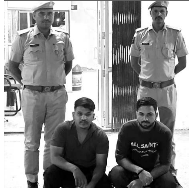
पुलिस ने सट्टा लगाते दो व्यक्तियों को गिरफ्तार किया।