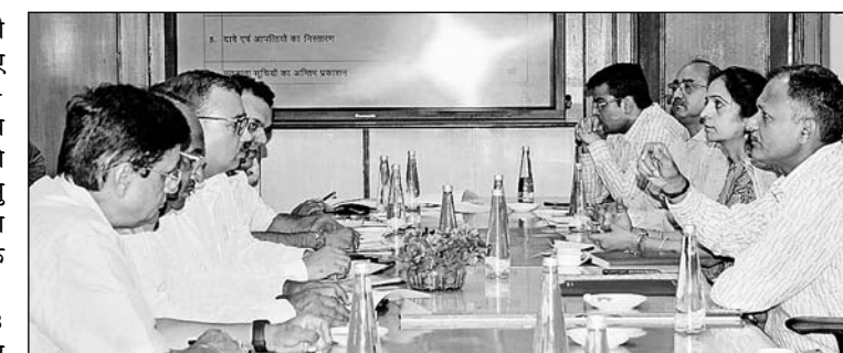
मुख्य निर्वाचन अधिकारी नवीन महाजन ने सोमवार को प्रदेश में मान्यता प्राप्त राजनैतिक दलों के प्रतिनिधियों के साथ बैठक की।

जयपुर। राजस्थान में 193 विधानसभा क्षेत्रों की मतदाता सूचियों को सुदृष्टिमान बनाने के लिए विशेष संक्षिप्त पुनरीक्षण (एस.एस.आर)-2025 अधिधान के तहत 29 अक्टूबर को प्रारूप सूचियों का प्रकाशन कर दिया गया है। अब जो नागरिक 1 जनवरी, 2025 को 18 वर्ष की आयु प्राप्त कर रहे हैं, वे नाम मतदाता सूची में जुड़वा सकते हैं। इसके अतिरिक्त, 17 वर्ष से अधिक आयुवर्ग के ऐसे मतदाता, जो वर्ष 2025 के 1 अप्रैल, 1 जुलाई, 1 अक्टूबर 2025 को 18 वर्ष की आयु पूरी कर मतदाता होने की पात्रता प्राप्त कर रहे हैं, वे भी वीएचएएए अथवा वीएलओ अथवा वोट सर्विस पोर्टल के माध्यम से प्रारूप-6 में अग्रिम आवेदन कर सकते हैं।