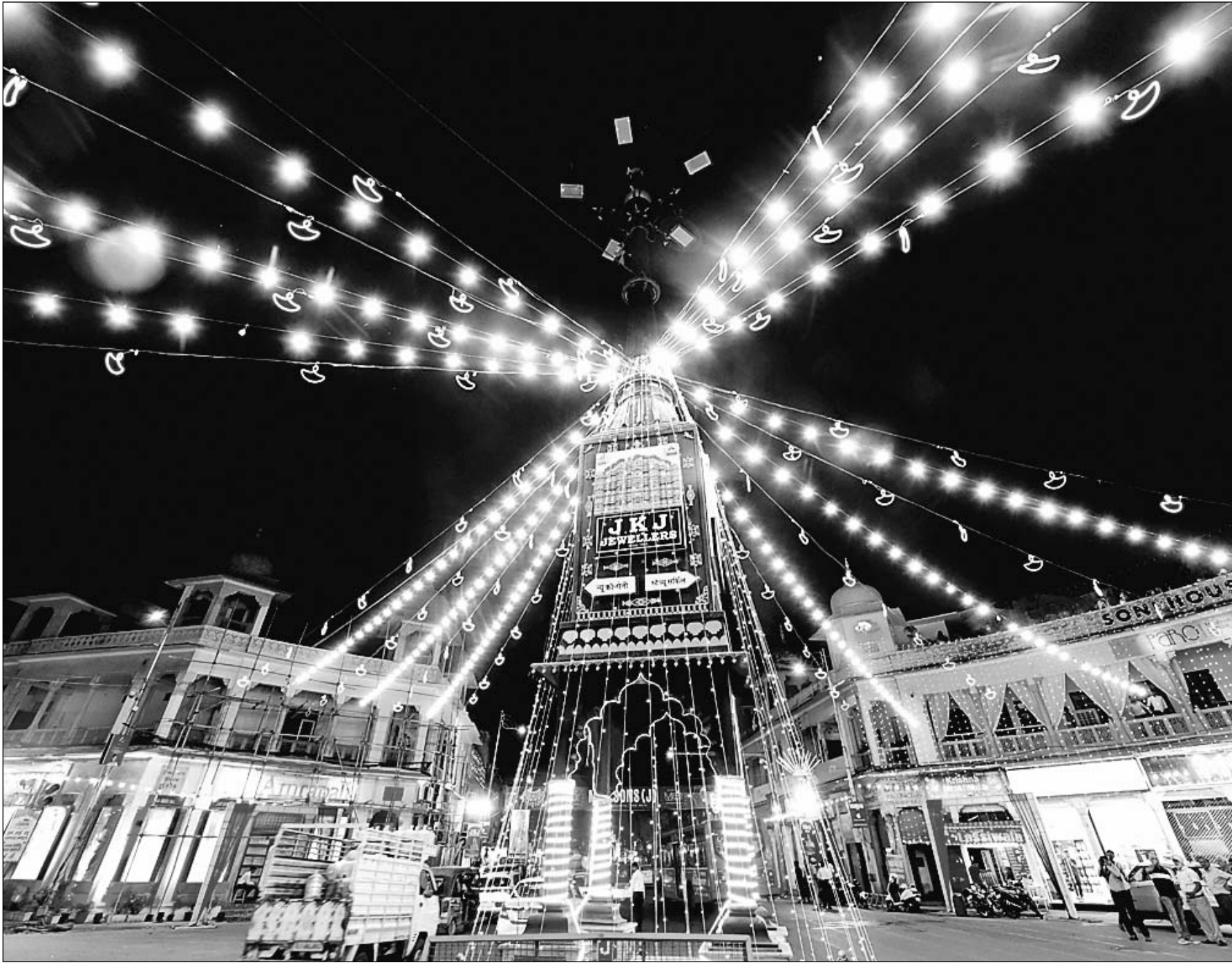
दीपोत्सव के लिये जगमगाने लगी गुलाबी नगरी। एम.आई.रोड पर लाइटिंग से जगमग पांचबत्ती चौराहा।