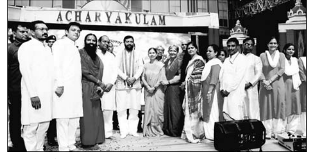
स्वामी रामदेव व आचार्य बालकृष्ण द्वारा स्थापित आवासीय शिक्षण संस्थान आचार्यकुलम् का वार्षिकोत्सव रविवार को धूमधाम से संपन्न हुआ।

जयपुर। स्वामी रामदेव व आचार्य बालकृष्ण द्वारा स्थापित आवासीय शिक्षण संस्थान आचार्यकुलम् का 12वां वार्षिकोत्सव आज धूमधाम से संपन्न हुआ। पंतजलि विश्वविद्यालय के प्रेक्षागृह में आयोजित "नेतृत्व के लिये शिक्षा" विषय पर आधारित वार्षिकोत्सव के मुख्य कार्यक्रम ने दर्शकों को मंत्रमुग्ध कर दिया। इस कार्यक्रम में भगवान श्रीराम, श्रीकृष्ण, आचार्य चाणक्य, सम्राट चन्द्रगुप्त, गुरुवर विरजानंद, महर्षि दयानंद सहित स्वामी व आचार्य के चरित्रों व नेतृत्व से समाहित प्रेरक झांकी का मंचन किया गया।