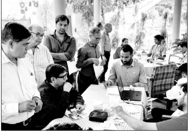
पिंकसिटी प्रेस क्लब में रविवार को निशुल्क चिकित्सा परामर्श एवं जांच कैम्प आयोजित किया गया।

जयपुर। पिंकसिटी प्रेस क्लब में रविवार को प्रियंका हॉस्पिटल कार्डियक सेंटर के सहयोग से निशुल्क चिकित्सा परामर्श एवं जांच कैम्प आयोजित किया गया। पिंकसिटी प्रेस क्लब की ओर से आयोजित इस कैम्प में पत्रकारों, मीडिया संस्थानों के विभिन्न विभागों में कार्यरत कार्मिक और उनके सैकड़ों परिवारों ने विभिन्न स्वास्थ्य विशेषज्ञों से निशुल्क चिकित्सा परामर्श और जांच का लाभ लिया।