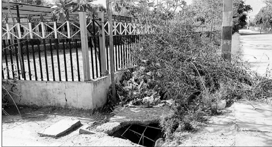
मालपुरा कोर्ट परिसर में कचरा डिपो बने पार्क में घटिया निर्माण से नाले क्षतिग्रस्त हो रहे हैं।

इतना ही नहीं नवीन न्यायालय भवन से जयपुर सड़क मार्ग तक बरसाती पानी