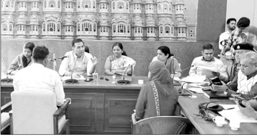
आमजन की परिवेदनाओं एवं समस्याओं की सुनवाई एवं त्वरित समाधान के लिए जिला कलेक्टर सभागार में जिला स्तरीय जनसुनवाई का आयोजन हुआ।