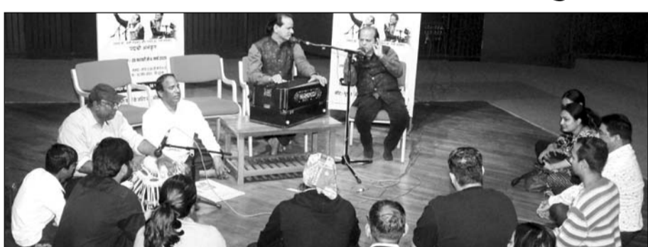
जवाहर कला केंद्र की ओर से आयोजित मांड गायन कार्यशाला का शुभारंभ हुआ।