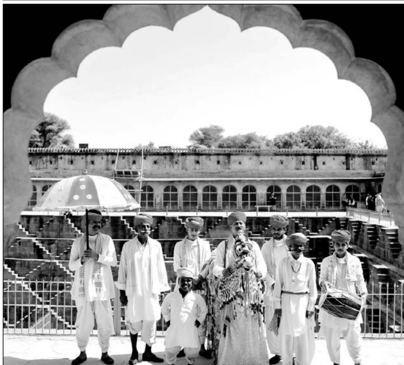
दौसा में दो दिवसीय आभानेरी फेस्टिवल में विदेशी पर्यटकों ने लुप्त उड़ाया।

दो दिन तक आभानेरी फेस्टिवल में देशी व विदेशी सैलानी राजस्थानी संस्कृति और अतिथि-सत्कार का आनंद लेंगे