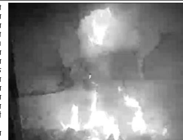
सज्जन एजेंसी के चप्पल गोदाम में भीषण आग से माल जल गया।