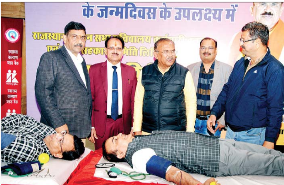
विधानसभाध्यक्ष वासुदेव देवनाणी के जन्म दिवस के अवसर पर गुरुवार को राजस्थान विधान सभा में विधानसभा कर्मियों द्वारा रक्तदान शिविर आयोजित किया गया।

जयपुर। विधानसभाध्यक्ष वासुदेव देवनाणी के जन्म दिवस (11 जनवरी) के चार दिवसीय कार्यक्रमों की गुरुवार से राजस्थान विधान सभा में विधानसभा कर्मियों द्वारा आयोजित सुंदरकांड, महाआरती और रक्तदान जैसे पावन व सनातन कार्यक्रमों से शुरुआत हुई। विधान सभा में अध्यक्ष वासुदेव देवनाणी