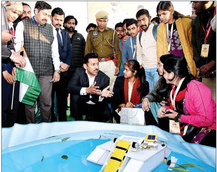
राज्य स्तरीय युवा महोत्सव में कर्नल राज्यवर्धन राठौड़ ने संवाद कार्यक्रम में युवाओं ने अपनी प्रतिभा का परिचय दिया।

रिस्पांसिबल, रिलायबल और राजिगंज राजस्थान की बनाने में युवाओं की महत्वपूर्ण भूमिका है। उन्होंने कहा कि कई लोग आशंका में भी खुश रहते हैं। हमें जीवन में खुशी की तलाश करनी चाहिए। युवा मामले एवं खेल मंत्री ने कहा कि युवाओं का राज्य स्तरीय युवा महोत्सव में आना व्यर्थ नहीं जाएगा, बल्कि यहां से अर्जित ज्ञान से वे अपने आप को बेहतर बना पाएंगे। कर्नल राठौड़ ने इससे पूर्व नई दिल्ली जा रहे दल के युवा सदस्यों से आत्मीयता से संवाद किया। इस दौरान विकास से लेकर कृषि और विज्ञान से लेकर कला पर युवाओं से अपने विचार व्यक्त किए। युवा मामले एवं खेल मंत्री ने युवाओं के विचारों और उनके