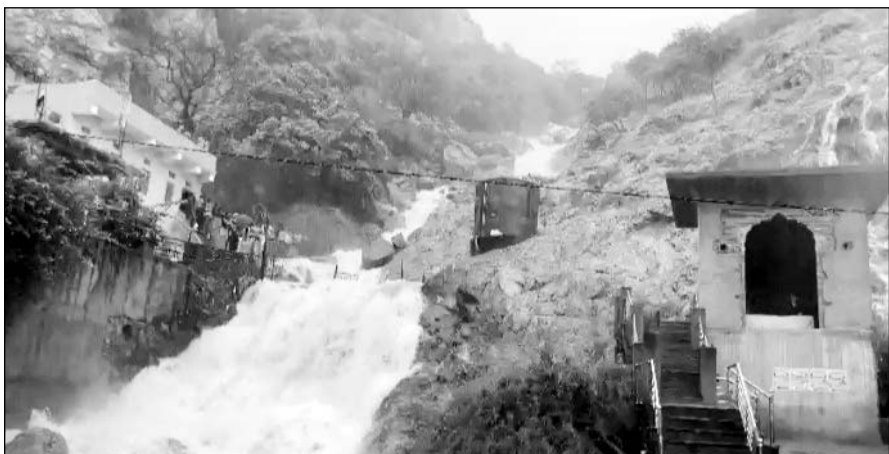
बरसात से सामोद के पास महार कलां स्थित मालेश्वर धाम की पहाड़ियों से नदी बहती नजर आई।

मोरिया, हाथनोदा, चौथवाड़ी, बासां, महार, कानपुरा सहित आसपास के कई गांवों में तेज बरसात होने के समाचार मिले हैं। बरसात होने से गांवों के खेतों में पानी भर गया। बरसात से सामोद के पास स्थित मालेश्वर धाम पर जोरदार नदी आई और झरने चल गये। नदी को देखने के लिये आसपास