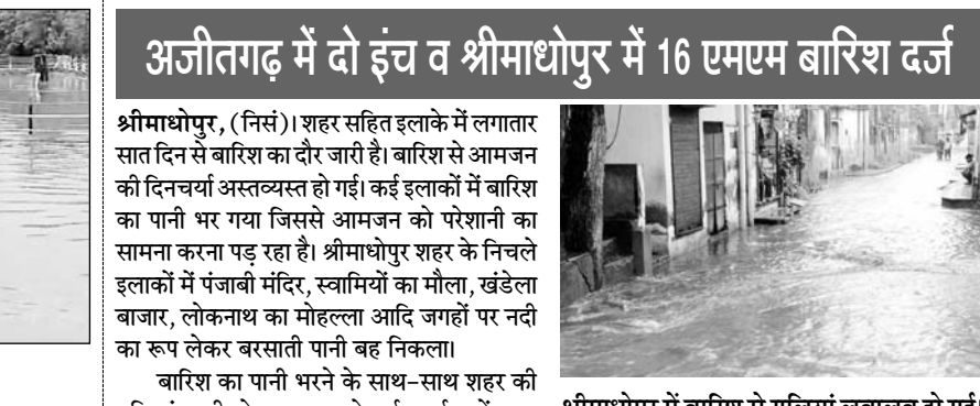
अजीतगढ़ में दो इंच व श्रीमाधोपुर में 16 एमएम बारिश दर्ज

नहीं नहीं के कारण न्यू मार्केट, हाथी पार्क, आजाद मार्केट सहित आसपास के इलाके में आवासीय क्वार्टरों में पानी घुस गया। क्षेत्र में करीब डेढ़ घंटे तक मध्यम बरसात होने से सड़कें दरिया बन गईं। बरसात के कारण आसपास के क्षेत्र के निचले इलाकों में पानी घुस गया, जिससे ग्रामीणों को काफी परेशानियों का सामना करना पड़ा। सिंधाना के ग्रामीणों ने बताया कि इंदिरा कॉलोनी, प्रभात कॉलोनी, मुख्य बाजार स्थित मुस्लिम बस्ती में पानी की सही निकासी नहीं होने के कारण ग्रामीणों को अनेक परेशानियों का सामना करना पड़ रहा है। तहसील रिकार्ड के अनुसार 1.3 एमएम बारिश दर्ज की गई है।