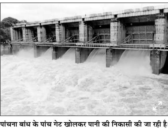
पांचना बांध के पांच गेट खोलकर पानी की निकासी की जा रही है।

करौली-मंडरायल मार्ग पर जाम लगाकर प्रदर्शन किया और जल निकासी के मार्ग में हो रहे अतिक्रमणों को हटाने की मांग की। जाम और प्रदर्शन की सूचना पर मंडरायल गिर गई। हालांकि जान-माल का नुकसान नहीं हुआ। इसी प्रकार वार्ड नंबर 44 में डांगरिया तालाब के ओवरफ्लो होने के चलते उसकी पाल तोड़कर पानी की निकासी की गई। एव माथुर स्टेडियम कि बाउंड्री, पावर हाउस की चारदीवारी ढह गई। करौली-मंडरायल मार्ग स्थित कई कॉलोनी में जलभराव से लोगों में आक्रोश है। आक्रोशित क्षेत्रवासियों ने