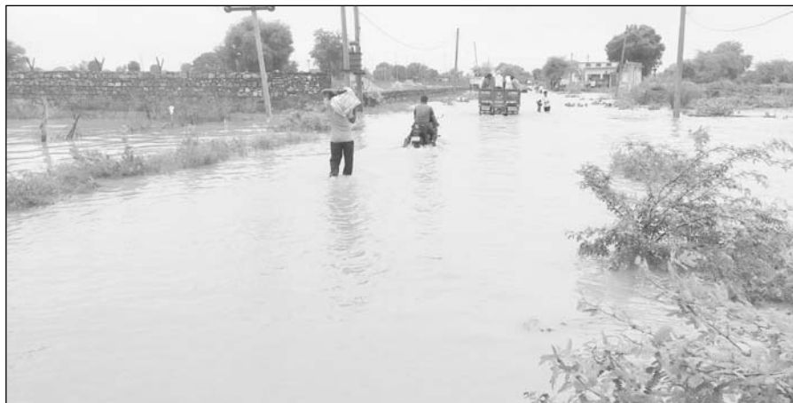
हिण्डौन सिटी शहर सहित आसपास के क्षेत्र में बारिश से कई इलाके जलमग्न हो गए।