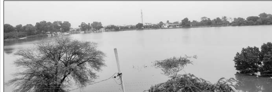
चाकसू कस्बे के बीचों-बीच स्थित मनहोरा तालाब ओवरफ्लो हो गया।

चाकसू, (निर्स)। मौसम विभाग की चेतावनी के मुताबिक क्षेत्र में तीन दिनों से लगातार बारिश हो रही है। आसमान से बरस रहे पानी से विधानसभा क्षेत्र के अधिकांशतः तालाब ओवरफ्लो हो गए हैं। बारिश से नगर पालिका क्षेत्र के निचले इलाकों और कच्चे-पक्के रास्तों में पानी भर गया है। बहुत से आम रास्ते तो कीचड़ में पसर पड़े हैं जिससे लोगों का आवागमन दुश्वार हो गया है। कस्बे के मध्य में स्थित मनहोरा तालाब ओवरफ्लो हो गया है। मनोहर तालाब के पानी निकासी का प्रशासन