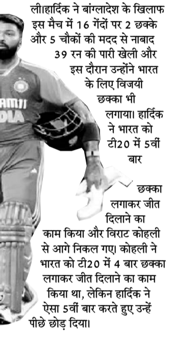
लगाकर जीत दिलाने का काम किया और विराट कोहली से आगे निकल गए। कोहली ने भारत को टी20 में 4 बार छक्का लगाकर जीत दिलाने का काम किया था, लेकिन हार्दिक ने ऐसा 5वाँ बार करते हुए उन्हें पीछे छोड़ दिया।

नई दिल्ली, 7 अक्टूबर। ग्वालियर में भारत और बांग्लादेश के बीच तीन मैचों की टी20 सीरीज का पहला मैच खेला गया जहाँ टीम इंडिया ने सूर्यकुमार यादव की कप्तानी में मेजबान टीम को 7 विकेट से जीत लिया। इस मुकामले में भारतीय टीम के स्टार ऑलराउंडर हार्दिक पांड्या का ऑलराउंडर प्रदर्शन देखने को मिला। उन्होंने इस मैच में विकेट भी झटके और भारत के लिए मैच जिताऊ पापी भी खेले। उन्होंने छक्का लगाकर विराट कोहली का रिकॉर्ड तोड़ दिया साथ ही युवराज सिंह को पछाड़ कर रोहित शर्मा की बराबरी भी कर