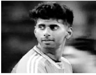
जो तुम्हें अच्छा लगता है। यह किसी भी तेज गेंदबाज के लिए बेहद महत्वपूर्ण होता है विशेषकर तब जबकि आप आप अपना पहला मैच खेल रहे हों। नीतीश ने भी सूर्यकुमार की जमकर प्रशंसा करते हुए कहा, "वह बहुत शांतचित्त कप्तान हैं। वह बहुत अच्छी कप्तानी कर रहे हैं। उन्होंने हम पर किसी तरह का कोई आवर में 21 रन देकर एक विकेट लिया। नीतीश ने भी 15 रनों पर नाबाद 16 रन बनाकर अपना प्रभाव छोड़ा। भारत ने यह मैच सात विकेट से जीता। मयंक ने बीसीसीआई टीवी से कहा, "वह (सूर्यकुमार) आपको पूरी आजादी देते हैं। जब मैं रन अप पर जा रहा था तो उन्होंने मुझसे कहा कि वही करो

ग्वालियर, 7 अक्टूबर। मयंक यादव और नीतीश कुमार रेड्डी बांग्लादेश के खिलाफ पहले टी20 अंतरराष्ट्रीय मैच में भारत के लिए पदार्पण करने से पहले थोड़ा नर्वस थे लेकिन उन्होंने कहा कि कप्तान सूर्यकुमार यादव ने लगातार उनका हौसला बढ़ाया जिससे उन्हें शांत बने रहने में मदद मिली। मयंक और नीतीश दोनों 21 साल के हैं और उन्होंने अपने पहले अंतरराष्ट्रीय मैच में अपने कौशल का प्रभाव छोड़ा।