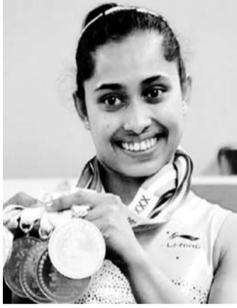
मेरे जीवन का केंद्र रहा और मैं उतार-चढ़ाव

नई दिल्ली, 7 अक्टूबर। भारत की स्टार जिम्नारिस्ट दीपा कर्माकर ने अचानक संन्यास लेकर सबको चौंका दिया है। दीपा 2016 के रियो ओलंपिक में पदक से चूक गई थीं, उन्होंने पांचवां स्थान हासिल किया था। 31 वर्षीय दीपा ओलंपिक में हिस्सा लेने वाली भारत की पहली महिला जिम्नारिस्ट बनीं थीं। उनका रियो ओलंपिक के वॉल्ट इवेंट में महज 0.15 पॉइंट से ओलंपिक में मेडल जीतने का सपना अधूरा रह गया था।