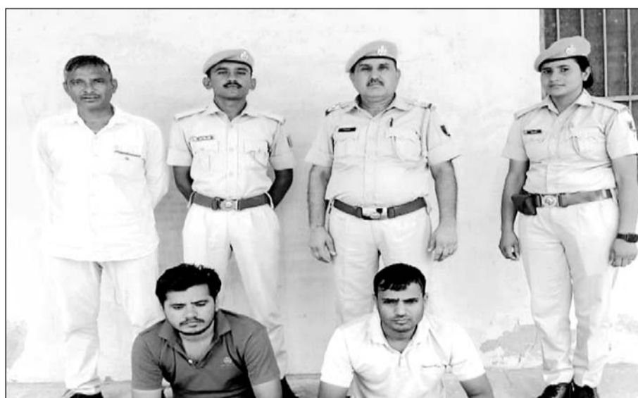
बिशनगढ़ थाना पुलिस ने अवैध मादक पदार्थ तस्करो के विरुद्ध कार्यवाही कर दो आरोपी गिरफ्तार किए।

जालोर, (कासं)। जालोर जिले के बिशनगढ़ पुलिस ने शुकवार को अवैध मादक पदार्थ तस्करो के विरुद्ध कार्यवाही कर एक किलो 60 ग्राम अवैध मादक पदार्थ अफीम का दूध बरामद कर दो आरोपियों को गिरफ्तार किया। मादक पदार्थ तस्करी में प्रयुक्त वाहन मोटरसाइकिल को जब्त किया।