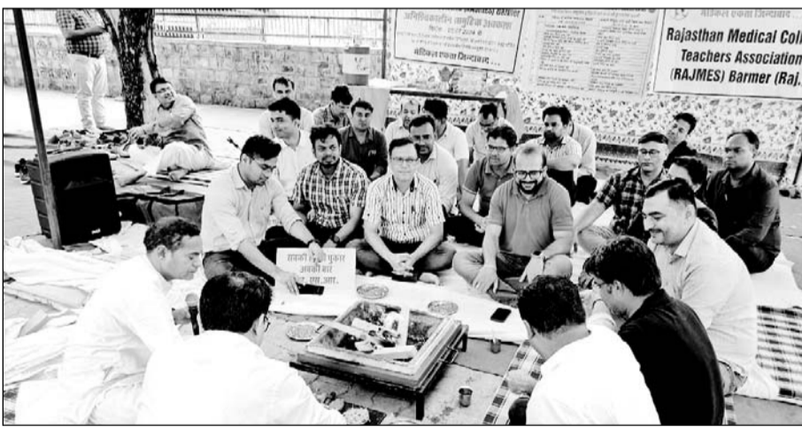
बाड़मेर में प्रोफेसर डॉक्टरों ने सरकार की सदबुद्धि के लिए धरना स्थल पर ड्राईंग कैडर शव यज्ञ किया। फोटो-राष्ट्रदूत

बाड़मेर, (नि.सं.)। राजस्थान चिकित्सा शिक्षा सोसाइटी (राजमेस) में पहले से कार्यरत चिकित्सक शिक्षकों को ड्राईंग कैडर घोषित करने के विरोध में राजकीय चिकित्सालय परिसर में डॉक्टरों पांचवें दिन भी हड़ताल पर रहे। इस दौरान चिकित्सक शिक्षकों द्वारा शुकवार की रात भी धरना प्रदर्शन जारी रहा। प्रोफेसर डॉक्टरों ने सरकार की सदबुद्धि के लिए धरना स्थल पर ड्राईंग कैडर शव को रखकर सदबुद्धि यज्ञ किया। वहीं चिकित्सकों द्वारा जमकर नारेबाजी भी की गई।