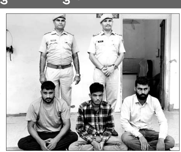
पुलिस ने हनीट्रेप मामले में तीन आरोपियों को गिरफ्तार किया।