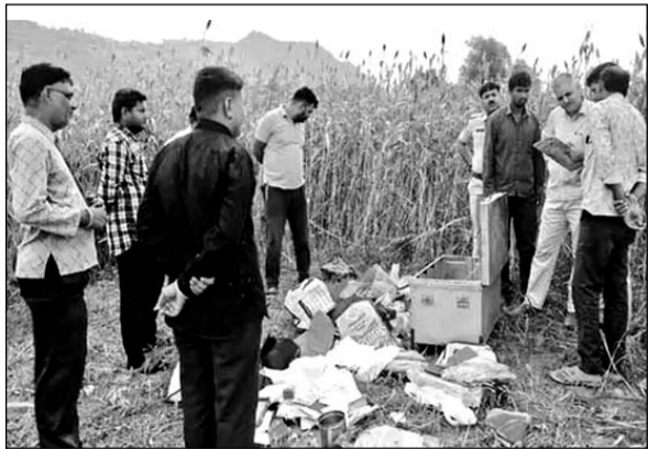
पुलिस ने खेत में पड़े बक्से की जानकारी ली।