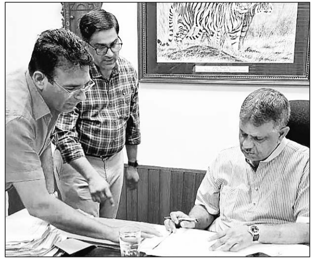
चिकित्सा एवं स्वास्थ्य मंत्री गजेन्द्र सिंह खींवर ने बुधवार को महिला स्वास्थ्य कार्यकर्ता के 3671 पदों पर अंतिम वरीयता सूची के लिये मंजूरी दी।