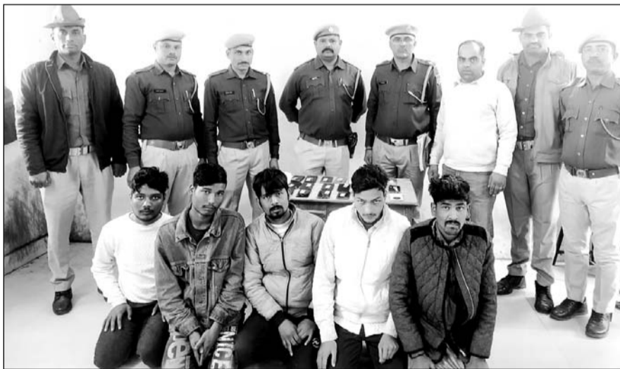
पुलिस ने मोबाइल चोरी के आरोपियों को पकड़ा।