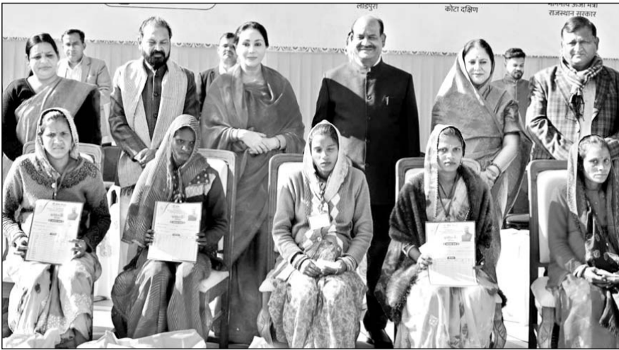
कोटा में "सुपोषित मां" अभियान के तहत लोकसभा अध्यक्ष ओम बिरला और उपमुख्यमंत्री दिया कुमारी ने गर्भवती महिलाओं को पोषण किट दिये।

मुख्य अतिथि लोकसभा अध्यक्ष ओम बिरला ने उपस्थित महिलाओं को संबोधित करते हुए कहा कि समाज को आने वाली पीढ़ी स्वस्थ हो एवं गर्भवती महिलाओं को पर्याप्त पोषण मिल सके, इस उद्देश्य से "सुपोषित मां" अभियान शुरू किया गया था। गरीब एवं वंचित वर्ग की गर्भवती महिलाओं को चिन्हित कर नौ माह तक उनकी निःशुल्क जांच एवं पोष्टिक आहार का इंतजाम करना इस अभियान की पहली प्राथमिकता है। उन्होंने उपस्थित लोगों का आभार किया कि उनके मोहल्ले, गांव-वाणी में कहीं भी ऐसी गर्भवती महिला मिले जिसे गरीबी के कारण पोष्टिक आहार नहीं मिल पा रहा हो उनकी जानकारी उपलब्ध कराएँ, ताकि "सुपोषित मां" अभियान के तृतीय चरण में उनके