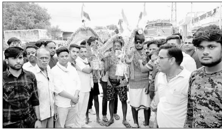
सुजानगढ़ में कावड़ियों का स्वागत करते हुए मुस्लिम समाज के लोग।