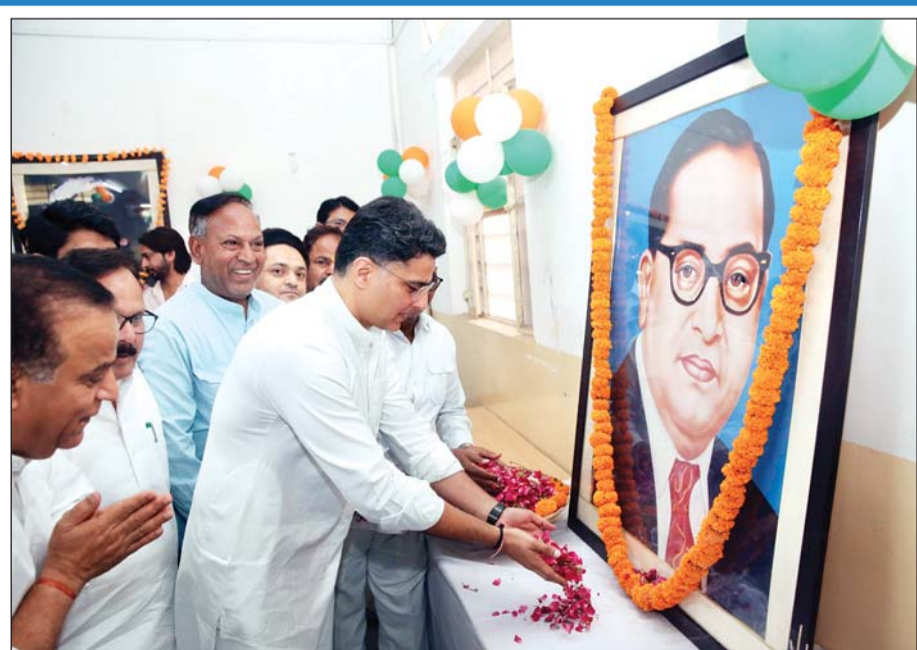
कांग्रेस के राष्ट्रीय महासचिव एवं पूर्व उपमुख्यमंत्री सचिन पायलट मंगलवार को प्रदेश कांग्रेस मुख्यालय में बाबा साहेब की जयंती पर आयोजित पुष्पांजलि कार्यक्रम में शामिल हुए।

पायलट ने कहा कि कांग्रेस पार्टी महिलाओं को अधिकार देने के लिए प्रतिबद्ध रही है। उन्होंने बताया कि मनमोहनसिंह सरकार के दौरान सोनिया गांधी के नेतृत्व में महिला आरक्षण विधेयक तैयार किया गया था, लेकिन उस समय यह पारित नहीं हो सका। उन्होंने कहा कि वर्तमान में सरकार इस दिशा में कदम उठा रही है, तो परिसीमन