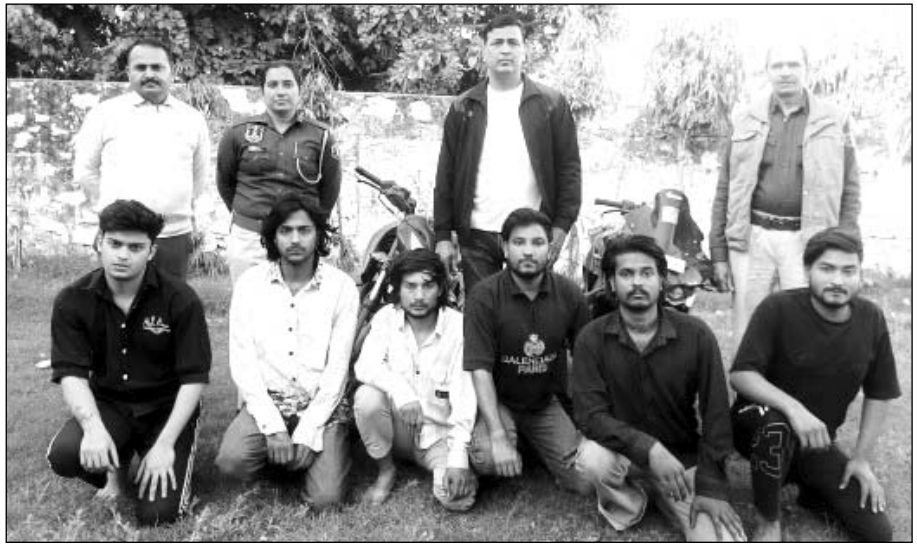
ब्रह्मपुरी थाना पुलिस ने कार्रवाई करते हुए छह आरोपियों को गिरफ्तार किया है।