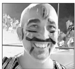
पुष्कर, (निर्सं।) पुष्कर में रावण दहन हुआ। विदेशी पर्यटक भी इस दौरान राक्षस का रूप बनाकर आया। विदेशी का रूप लोगों में रहा चर्चा का विषय रहा। पुष्कर में बांगड़ स्कूल के पास छोटी बस्ती की ओर से श्री ब्रह्म पुष्कर सेवा संघ की ओर से रावण दहन किया गया। बड़ी बस्ती में मेला मैदान में रावण दहन किया गया। इस दौरान पुष्कर के विधायक