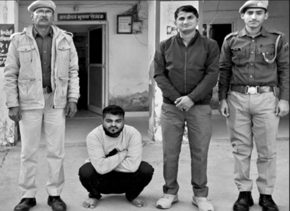
पुलिस ने गबन के मामले में फरार आरोपी को गिरफ्तार किया।