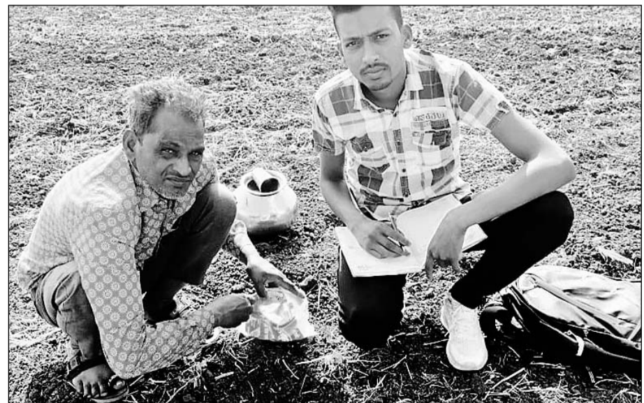
कृषि विभाग के कर्मचारियों ने ग्राम पंचायत जुलमी में मिट्टी जांच के लिये नमूना लिया।

रामगंजमंडी (निर्स)। कृषि विभाग द्वारा खरीफ सीजन को देखते हुए मिट्टी जांच की प्रक्रिया शुरू कर दी गयी है। जिसके अंतर्गत किसानों के खेतों में से मिट्टी के नमूने लिए जा रहे हैं।