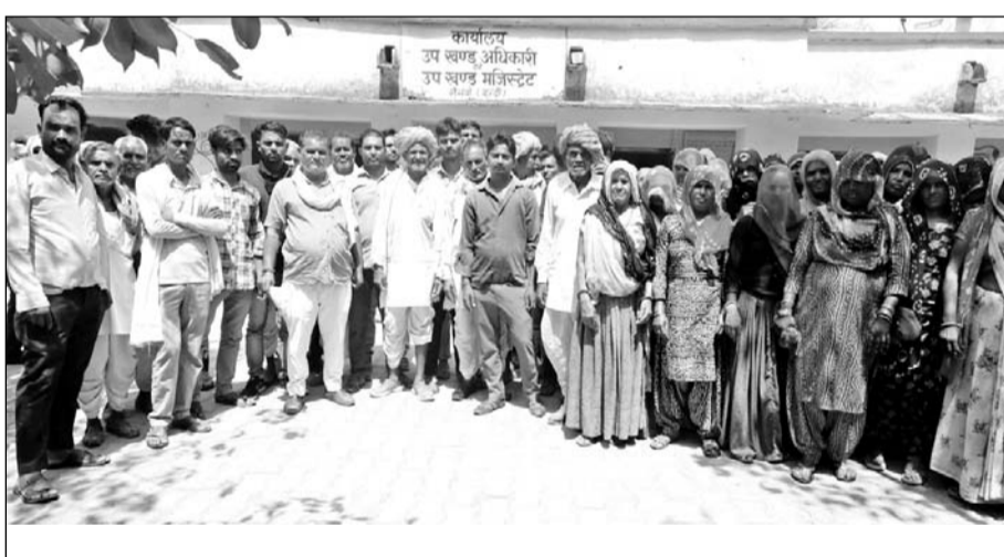
ग्रामीणों ने अतिक्रमण को हटाने की मांग को लेकर जिला कलेक्टर के नाम नैनवां उपखंड अधिकारी कार्यालय पर ज्ञापन दिया।

अतिकर्मी मारपीट पर भी आमादा हो जाता है। पूर्व में ग्रामीणों व पंचायत प्रशासन द्वारा विकास अधिकारी को ज्ञापन देकर अवगत करवाया गया था। जिस पर विकास अधिकारी द्वारा तहसीलदार से रास्ते का सीमा ज्ञान