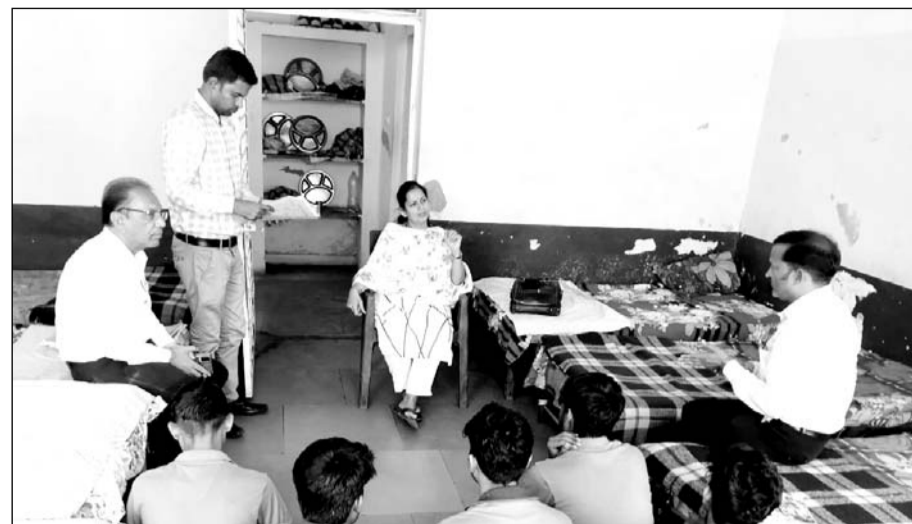
जिला विधिक सेवा प्राधिकरण ने राजकीय सम्प्रेषण एवं किशोर गृह बूंदी का निरीक्षण किया।

बूंदी (निर्स)। जिला विधिक सेवा प्राधिकरण द्वारा बुधवार को राजकीय सम्प्रेषण एवं किशोर गृह बूंदी का निरीक्षण किया।