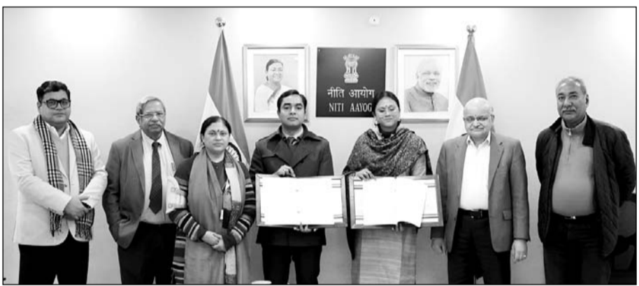
भारत सरकार के नीति आयोग और एसोसिएशन फॉर वालंटरी एक्शन ( एवीए ) ने देश के सबसे पिछड़े क्षेत्रों में बच्चों की शिक्षा आदि के लिए हाथ मिलाया है।