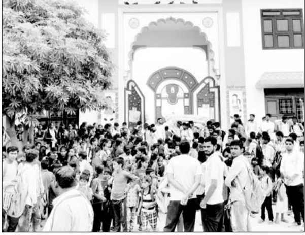
मुण्डावरा में विद्यालय को महात्मा गांधी इंग्लिश मीडियम में मर्ज किये जाने पर विद्यार्थी और ग्रामीणों ने 2 घंटे विरोध प्रदर्शन किया।

नारायणपुर, (निर्सं)। राज्यसरकार द्वारा उपखंड क्षेत्र की ग्राम पंचायत मुण्डावरा में स्थित राजकीय उच्च माध्यमिक विद्यालय को महात्मा गांधी इंग्लिश मीडियम में मर्ज किये जाने पर बुधवार को विद्यार्थी और ग्रामीणों ने स्कूल की तालाबंदी करके करीब 2 घंटे विरोध प्रदर्शन किया। इस दौरान ग्रामीणों ने बताया कि विद्यालय में करीब 700 विद्यार्थी अध्ययनरत हैं, जिसको महात्मा गांधी इंग्लिश मीडियम स्कूल में मर्ज कर दिया गया है, जबकि उनमें से अधिकांश छात्रा हैं और करीब 10 किलोमीटर की दूरी में कोई सीनियर स्कूल नहीं है, जिसमें दो संकाय संचालित है। सरकार द्वारा जो विद्यालय मर्ज किया गया है वो गलत है और सरकार द्वारा क्षेत्र की बालिका और हिंदी मीडियम के विद्यार्थियों के भविष्य से खिलवाड़ किया जा रहा है। इसको लेकर ग्राम पंचायत सरपंच और ग्रामीणों ने सीनियर स्कूल को