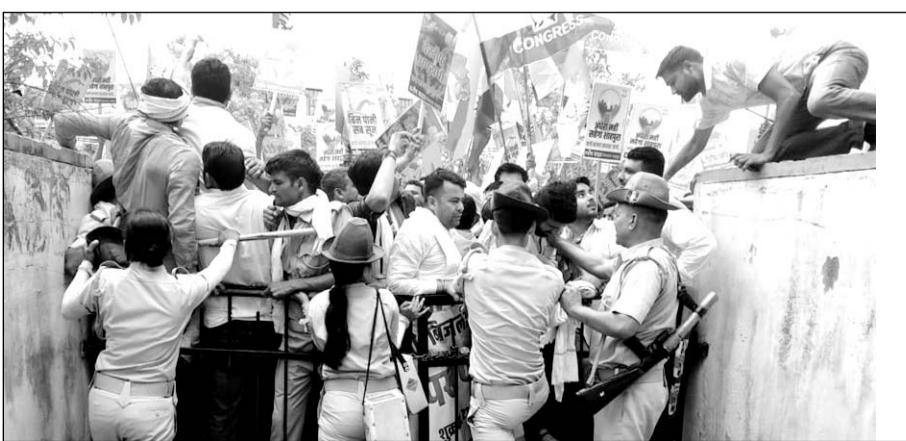
पुलिस व आरएसी बटालियन के जवानों ने प्रदर्शनकर्ताओं को कडी मशक्कत कर काबू किया।

शाहपुरा, (निर्स)। शाहपुरा क्षेत्र में बिजली, पानी व बिजली तथा कानून व्यवस्था को लेकर कांग्रेस कार्यकर्ताओं ने शुक्रवार को विधायक मनीष यादव की अगुवाई में भाजपा सरकार के खिलाफ जमकर हल्ला बोला और 1 घंटे तक तहसील कार्यालय के बाहर कार्यकर्ताओं ने जमकर विरोध प्रदर्शन कर नारेबाजी की। तहसील कार्यालय के मुख्य गेट पर जब पुलिस व आरएसी के जवानों ने कार्यकर्ताओं को रोका तो कार्यकर्ताओं का गुस्सा उबल पडा। कार्यकर्ताओं के गुस्से को देखते हुए पुलिस व आरएसी बटालियन के जवानों ने कडी मशक्कत कर स्थिति को काबू में किया। विधायक मनीष यादव के नेतृत्व में विधानसभा क्षेत्र के कांग्रेस कार्यकर्ताओं ने कृषि उपज मंडी से एसडीएम कार्यालय तक आक्रोश रैली निकाली। जिसमें कार्यकर्ताओं ने