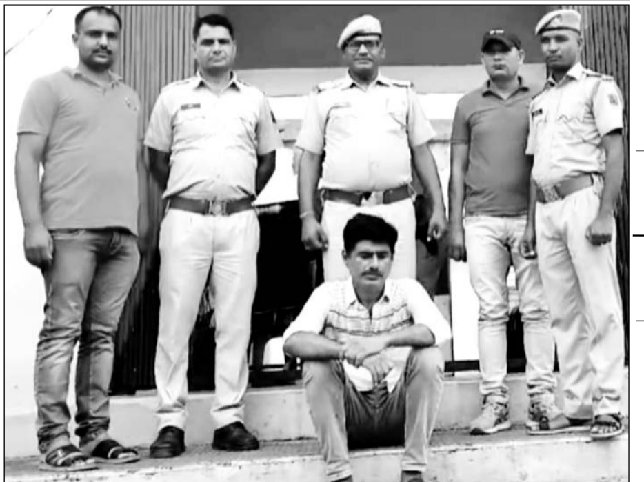
एंटी गैंगस्टर टास्क फोर्स की सूचना पर ब्यावर जिले में बर पुलिस ने तस्कर को गिरफ्तार किया।