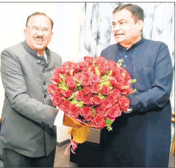
राजस्थान विधानसभा अध्यक्ष वासुदेव देवनानी ने शनिवार को नागपुर प्रवास के दौरान केंद्रीय सड़क परिवहन मंत्री नितिन गडकरी से शिष्टाचार मुलाकात की। इस दौरान गडकरी ने अपनी पुस्तक अनमार्किंग इंडिया की प्रति देवनानी को भेंट की।

जयपुर। विधानसभा अध्यक्ष वासुदेव देवनानी ने कहा है कि प्रकृति जीवन दायिनी है, इसकी रक्षा करना हम सभी का कर्तव्य है। हम सभी को मिलकर पर्यावरण का संरक्षण करना है। देश का भविष्य आज का युवा है। उसके कंधों पर जिम्मेदारी है। यदि युवा किसी कार्य को पूरा करने की ठान ले तो सब कुछ संभव हो सकता है। देवनानी ने युवाओं का आवाहन किया वे विकसित भारत की कल्पना को साकार करें और पर्यावरण का संरक्षण करने में अपना योगदान दें।