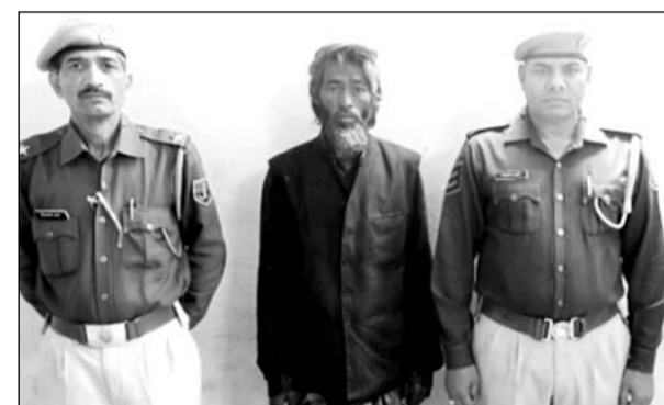
पुलिस गिरफ्त में बांग्लादेशी नागरिक।

अजमेर, (कासं)। अजमेर पुलिस की स्पेशल टास्क फोर्स द्वारा अवैध रूप से रह रहे बांग्लादेशी नागरिकों की धरपकड़ के लिए चलाए जा रहे अभियान में कार्रवाई करते हुए गुरुवार को चौथी कार्यवाही करते हुए दरगाह थाना पुलिस ने चोरी छिपे बांडर क्रॉस कर भारत में प्रवेश कर दरगाह क्षेत्र में रह रहे बांग्लादेशी को गिरफ्तार किया है।