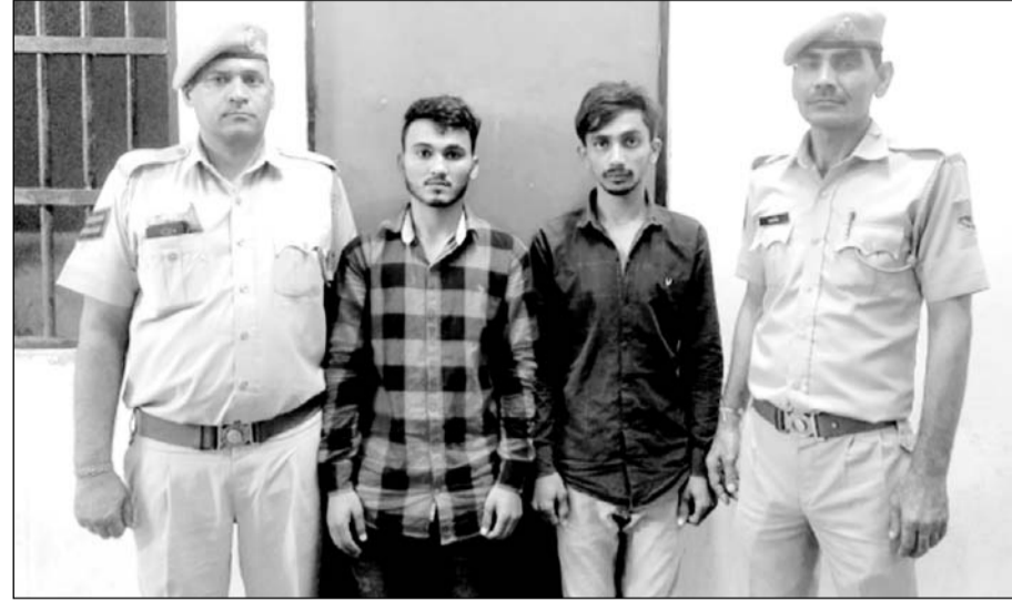
दरगाह थाना पुलिस ने एटीएम कार्ड चोरी कर रुपए निकालने वाले आरोपियों को पकड़ा।

दरगाह थाना पुलिस ने 17 हजार 500 रुपए और दो एटीएम कार्ड बरामद किए