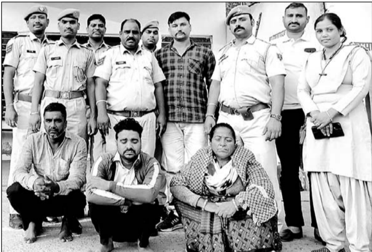
पुलिस ने मध्यप्रदेश के गिरोह को गिरफ्तार किया।