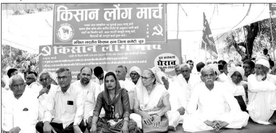
फसल बीमा क्लेम सहित 22 सूत्री मांगों को लेकर किसानों ने कलेक्ट्रेट का घेराव कर प्रदर्शन किया।