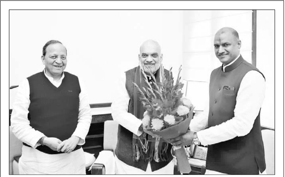
राजस्थान में भाजपा को स्पष्ट बहुमत मिलने के बाद भाजपा प्रदेश अध्यक्ष सी.पी. जोशी ने सोमवार को भाजपा राष्ट्रीय अध्यक्ष जे.पी. नड्डा व केंद्रीय गृहमंत्री अमित शाह से मुलाकात की।

जयपुर, (का.सं.)। राजस्थान में 199 विधानसभा सीटों पर हुए चुनाव के नतीजे सामने आ चुके हैं लेकिन इसमें सबसे ज्यादा हैरानी की बात यह है कि तीन लाख 82 हजार 45 वोटर्स ने 'नोटा' का विकल्प चुना है। यह वोट प्रदेश की 13 विधानसभा क्षेत्रों में पड़े हैं। ऐसे में सवाल यह उठता है कि कांग्रेस व भाजपा के साथ-साथ अन्य राजनैतिक दलों और निदर्लीय प्रत्याशियों में क्या एक भी योग्य उम्मीदवार इन लोगों की नजर में नहीं था। जानकारी के मुताबिक नसीराबाद, कटूमर, बांसवाड़ा, बायत, चोहटन, आसीन्द, जहाजपुर, कोटपुतली, हवामहल, भीनमाल, जायल, खींवर और मावली विधानसभा क्षेत्र के लोगों ने नोटा का विकल्प चुना।