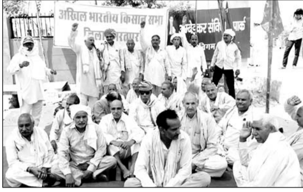
भरतपुर में किसानों ने धरना दिया।