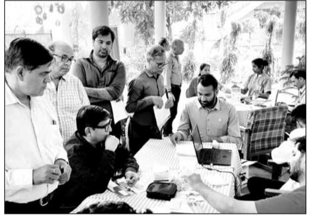
पिंकसिटी प्रेस क्लब में रविवार को निशुल्क चिकित्सा परामर्श एवं जांच कैम्प आयोजित किया गया।

जयपुर। पिंकसिटी प्रेस क्लब में रविवार को प्रियंका हॉस्पिटल कार्डियक सेंटर के सहयोग से निशुल्क चिकित्सा परामर्श एवं जांच कैम्प आयोजित किया गया। पिंकसिटी प्रेस क्लब की ओर से आयोजित इस कैम्प में पत्रकारों, मीडिया संस्थानों के विभिन्न विभागों में कार्यरत कार्मिकों और उनके सैकड़ों परिवारों ने विभिन्न स्वास्थ्य विशेषज्ञों से निशुल्क चिकित्सा परामर्श और जांच का लाभ लिया।