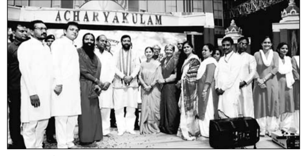
स्वामी रामदेव व आचार्य बालकृष्ण द्वारा स्थापित आवासीय शिक्षण संस्थान आचार्यकुलम् का वार्षिकोत्सव रविवार को धूमधाम से संपन्न हुआ।

जयपुर। स्वामी रामदेव व आचार्य बालकृष्ण द्वारा स्थापित आवासीय शिक्षण संस्थान आचार्यकुलम् का 12वां वार्षिकोत्सव आज धूमधाम से संपन्न हुआ। पंतजलि विश्वविद्यालय के प्रेक्षागृह में आयोजित "नेतृत्व के लिये शिक्षा" विषय पर आधारित वार्षिकोत्सव के मुख्य कार्यक्रम ने दर्शकों को मंत्रमुग्ध कर दिया। इस कार्यक्रम में भगवान श्रीराम, श्रीकृष्ण, आचार्य चाणक्य, सम्राट चन्द्रगुप्त, गुरुवर विरजानंद, महर्षि दयानंद सहित स्वामी व आचार्य के चरित्रों व नेतृत्व से समाहित प्रेरक झांकी का मंचन किया गया।