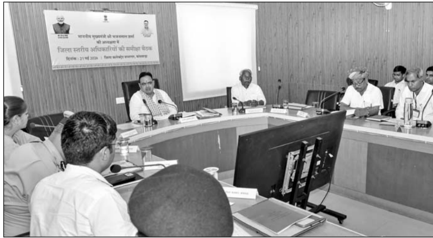
मुख्यमंत्री भजनलाल शर्मा ने बांसवाड़ा में जिला स्तरीय अधिकारियों की बैठक ली।

बांसवाड़ा और डूंगरपुर जिले के तीन दिवसीय प्रवास के दूसरे दिन मुख्यमंत्री ने गुरुवार को बांसवाड़ा जिला कलेक्ट्रेट सभागार में जिला स्तरीय अधिकारियों की बैठक में विभिन्न योजनाओं, कार्यक्रमों, अभियानों तथा नवाचारों की प्रगति एवं वर्तमान स्थिति पर समीक्षा की। उन्होंने प्रवृत्तित्व एवं क्षेत्र वार अवतक प्राप्त उपलब्धियों की जानकारी ली तथा इनके क्रियान्वयन में तेजी लाए जाने के निर्देश दिए। मुख्यमंत्री ने नहरों में तालाबों की उपयुक्त साफ-सफाई सुनिश्चित करने के निर्देश देते हुए कहा कि नहरों में जल वितरण तथा वर्षा काल से पूर्व जिले के जलाशयों की सफाई पर गंभीरता बरतें। उन्होंने माही की एक-एक बूंद के सदुपयोग का आह्वान करते हुए