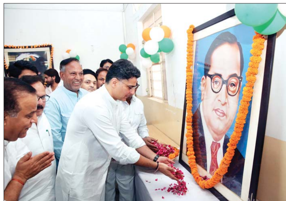
कांग्रेस के राष्ट्रीय महासचिव एवं पूर्व उपमुख्यमंत्री सचिन पायलट मंगलवार को प्रदेश कांग्रेस मुख्यालय में बाबा साहेब की जयंती पर आयोजित पुष्पांजलि कार्यक्रम में शामिल हुए।

पायलट ने कहा कि कांग्रेस पार्टी महिलाओं को अधिकार देने के लिए प्रतिबद्ध रही है। उन्होंने बताया कि मनमोहनसिंह सरकार के दौरान सोनिया गांधी के नेतृत्व में महिला आरक्षण विधेयक तैयार किया गया था, लेकिन उस समय यह पारित नहीं हो सका। उन्होंने कहा कि वर्तमान में सरकार इस दिशा में कदम उठा रही है, तो परिसीमन