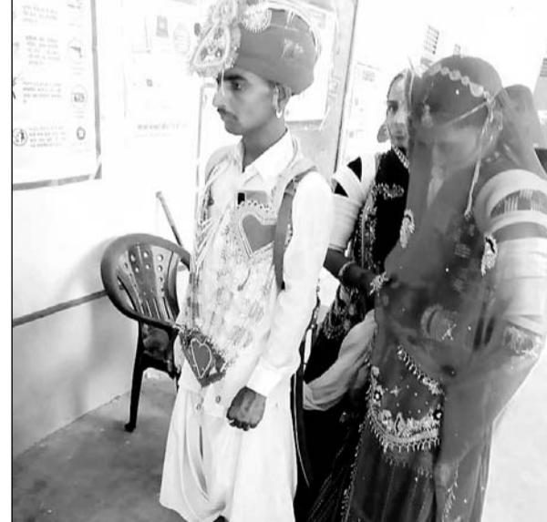
जालोर में दुल्हा दुल्हन ने मतदान किया।

जालोर, (निर्स)। जालोर जिले के रेवतडा ग्राम के मतदान केंद्र पर शुक्रवार को 83 वर्षीय वृद्धा ने अपने मत का प्रयोग कर देश की सरकार चुनने में अपनी धूमिता निभाई।