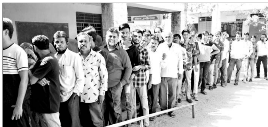
जालोर में मतदान के लिए सुबह के समय मतदाताओं की कतारें नजर आईं।

सहित क्षेत्र में शांतिपूर्ण मतदान हुआ। लोकसभा चुनाव में मतदान को लेकर लोगों में कोई खास उत्साह नजर नहीं आया।