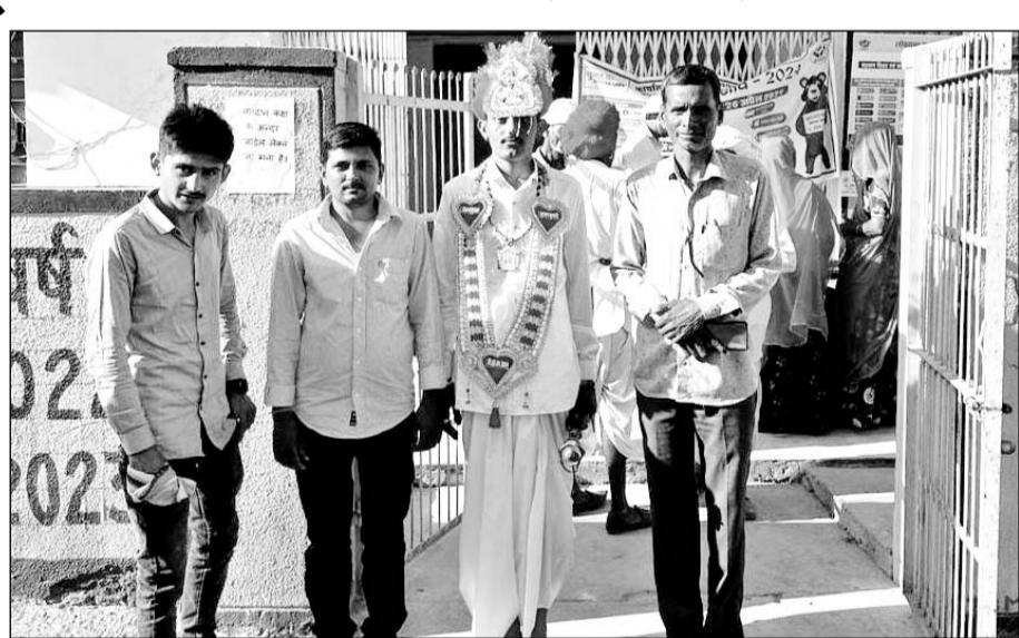
सायला के पास देता कलां में एक दूल्हा शादी से पहले मतदान करने पहुंचा।

बाप, (निर्स)। लोकतंत्र के महापर्व के द्वितीय चरण में शुक्रवार को बाप कस्बा