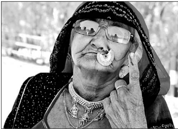
जोधपुर में बुजुर्ग महिला ने उत्साह से मतदान किया।