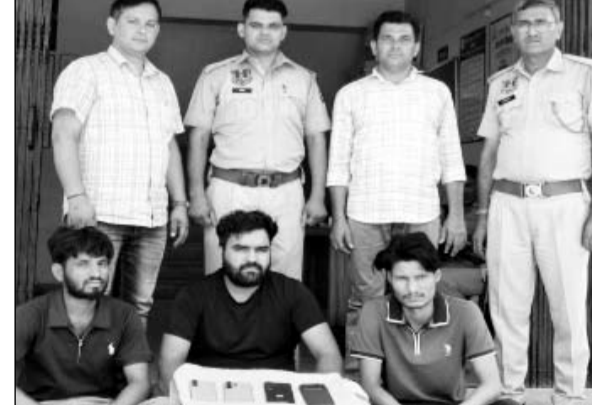
जामडोली थाना पुलिस ने फ्लिपकार्ट की डिलीवरी में महंगे सामान चुराने वाले बदमाशों को गिरफ्तार किया।

-कार्यालय संवाददाता- जयपुर। राजधानी में ऑनलाइन शॉपिंग कंपनियों और डिलीवरी नेटवर्क को निशाना बनाकर महंगे मोबाइल और इलेक्ट्रॉनिक सामान हड़पने वाले एक हाईटेक गिरोह का जामडोली थाना पुलिस ने पर्दाफाश किया है। पुलिस ने फ्लिपकार्ट से महंगे आईफोन, एंड्रॉयड फोन और आईपैड