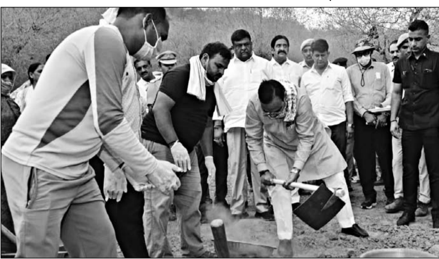
मुख्यमंत्री भजनलाल शर्मा ने शुक्रवार को नींदड वन क्षेत्र में बंदे गंगा जल संरक्षण-जन अभियान के तहत एनिकट पर श्रमदान किया।

जयपुर (कास)। मुख्यमंत्री भजनलाल शर्मा ने शुक्रवार को नींदड वन क्षेत्र में नींदड-बैनाड बायोडाइवर्सिटी प्रोजेक्ट ईको ट्रेल का उद्घाटन किया। इस अवसर पर उन्होंने बंदे गंगा जल संरक्षण-जन अभियान के तहत एनिकट पर श्रमदान कर आमजन से जल संरचनाओं के संरक्षण एवं संवर्धन में सहभागिता निभाने का आह्वाण किया। मुख्यमंत्री ने कहा कि नींदड वन अत्यंत सुंदर और संभावनाओं से परिपूर्ण क्षेत्र है। राज्य सरकार इसे सघन पौधारोपण के माध्यम से विकसित करेगी, ताकि यहां प्रकृति पर्यटन को भी बढ़ावा मिल सके। उन्होंने कहा कि बंदे गंगा जल संरक्षण-जन अभियान के अंतर्गत