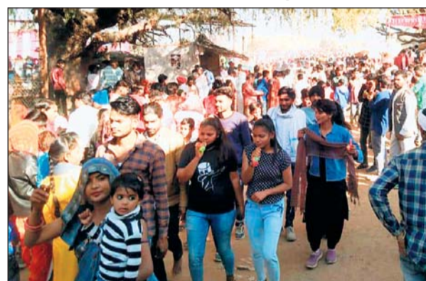
तामडिया गांव के प्रसिद्ध लोक देवता भैरुजी मन्दिर में लगे मेले में श्रद्धालु नाचते-गाते पहुंचे।