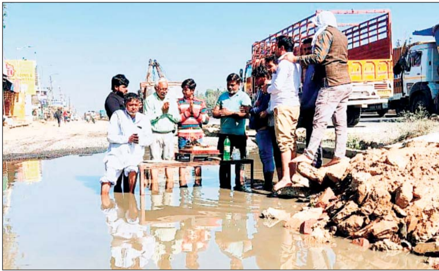
कोटपूतली में राजमार्ग स्थित बुढ़ी के होटल के पास लम्बे समय से सर्विस लाइन के क्षतिग्रस्त होने व जल भराव से आक्रोशित लोगों ने पानी के अंदर खड़े होकर सदबुद्धि यज्ञ किया।

जिससे ना केवल सफर करने वालों के लिए यह परेशानी का सबब बन रहा है। लेकिन बावजूद इसके भी एनएचएआई द्वारा उक्त हाईवे पर लगातार टोल वसूली जारी है। ऐसा नहीं है कि सरकारों या अधिकारी हाईवे के