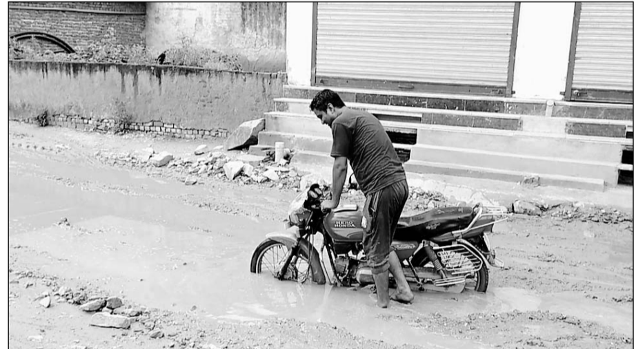
पावटा में कॉलोनीयों में भरे कीचड़ में फंसा बाइक सवार।

पावटा, (निर्सं)। बारिश के चलते जगह-जगह कॉलोनीयों में जलभराव की समस्या लोगों के लिए मुसीबत बन रही है। कुछ दिनों से रूक-रूककर बारिश होने व कॉलोनीयों में जल निकासी नहीं होने के कारण लोगों को आने-जाने में परेशानी का सामना करना पड़ रहा है।