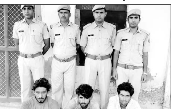
अलवर पुलिस ने कार्रवाई कर आरोपियों को गिरफ्तार किया।

सफलता पुलिस के हाथ लगी है। घटना की गम्भीरता को देखते हुये एसीपी के निर्देश के बाद घटना स्थल का एफएएसएल टीम द्वारा निरीक्षण किया गया तथा लगभग 50 संदिग्ध व्यक्तियों से पूछताछ की गई तथा तकनीकी साक्ष्यों का साईबर टीम अलवर द्वारा विश्लेषण किया जाकर उस संशोध में भी अनेक संदिग्ध व्यक्तियों से पूछताछ की गई।