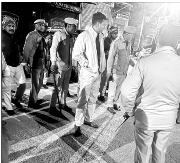
जयपुर पुलिस ने शनिवार अल सुबह अभियान चलाकर 200 हार्डकोर और संदिग्ध बदमाशों के ठिकानों पर दबिश दी।