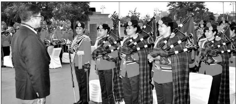
गणतंत्र दिवस की पूर्व संध्या पर जनपथ स्थित अमर जवान ज्योति पर राजस्थान पुलिस की कई बटालियन के बैंडवादकों ने देशभक्ति से ओतप्रोत प्रस्तुतियां दी।

गणतंत्र दिवस की पूर्व संध्या पर जनपथ स्थित अमर जवान ज्योति पर हुआ विशेष कार्यक्रम का आयोजन