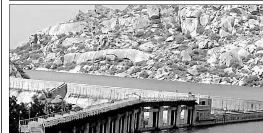
अरावली के पहाड़ियों में वर्षा होने से जवाई बांध में पानी आने का क्रम जारी।

प्रशासन ने जोधपुर से आ रही वाटर ट्रेन को आज से बंद करने का निर्णय लिया