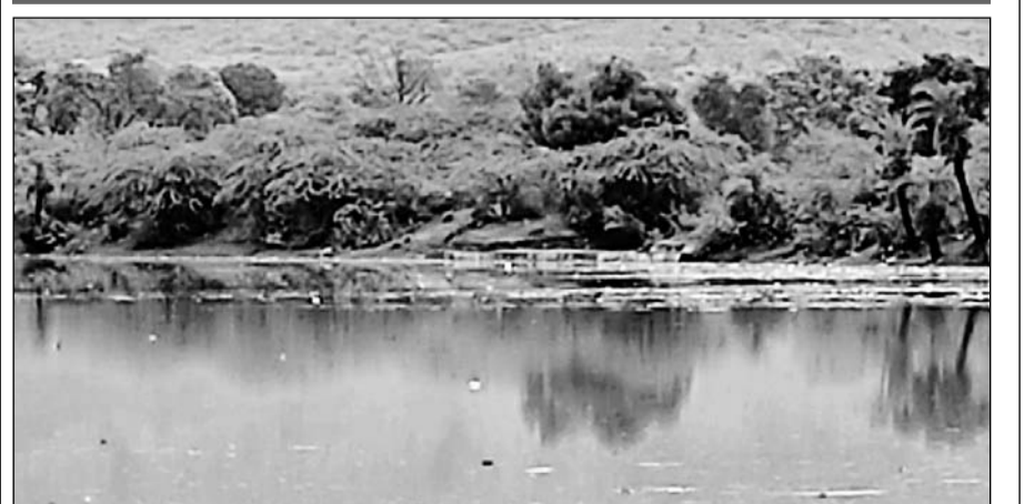
पिण्डवाड़ा में मूसलाधार बारिश होने से शहर का अखेलाव तालाब लबालब हो गया।

पिण्डवाड़ा में मानसून की दस्तक, सवा चार इंच पानी बरसा, कादंबरी बांध में 6 फीट पानी आया