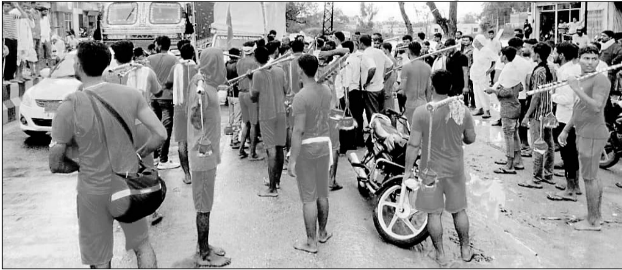
चाकसू में पुलिस व कावड़ यात्रियों के आमने-सामने होने के बाद जाप के हालात बन गये।