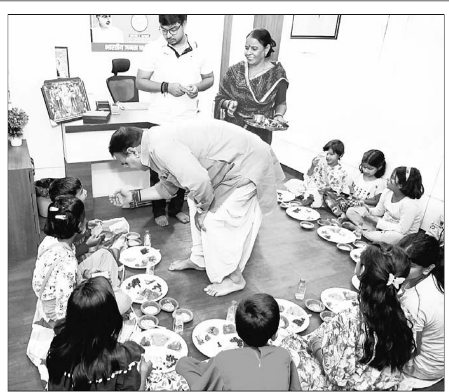
रामनवमी के अवसर पर गुरूवार को मुख्यमंत्री भजनलाल शर्मा ने परिवार सहित कन्याओं का पूजन किया और उन्हें भोज करावाया।

इन कार्यक्रमों में भाजपा के शहर पदाधिकारी, मंडल अध्यक्ष व कार्यकारिणी के साथ ही संगठन के मोर्चों विभागों और प्रकोष्ठों के पदाधिकारी व कार्यकर्ता उनके साथ रहे।