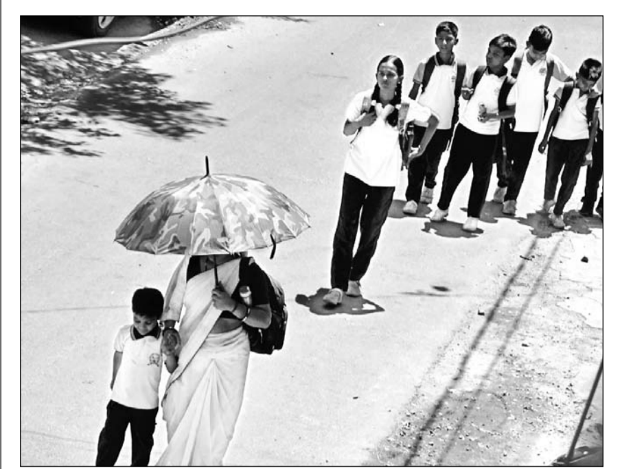
जिला कलैक्टर के आदेश हवा : भीषण गर्मी व तेज धूप के कारण जिला कलैक्टर ने सभी स्कूलों में छोटे बच्चों को राहत देते हुए साढ़े ग्यारह तक छुट्टी करने के आदेश दिये लेकिन निजी स्कूल आदेश को नज़र अंदाज़ कर बच्चों को तपती दोपहर में 12 बजे बाद घर जाने को भेज रहे।

ने इस हमले को अत्यंत निंदनीय करार देते हुए कहा कि निहत्थे पर्यटकों पर किया गया यह आतंकी हमला कायरता का प्रतीक है। उन्होंने कहा कि सरकार इस दुःखद घड़ी में शोक संतप्त परिजनों के साथ खड़ी है और उन्हें हरसंभव सहायता प्रदान की जाएगी।