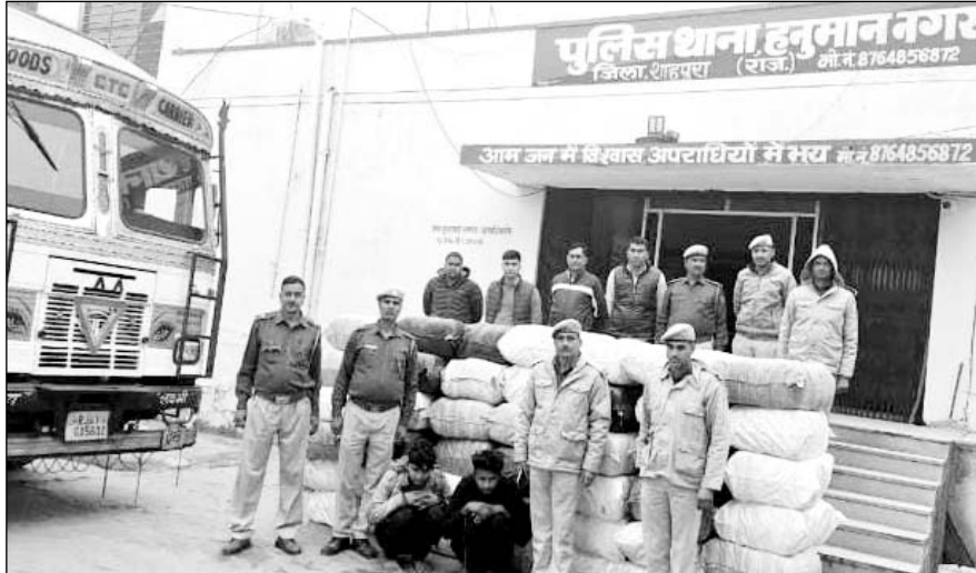
हनुमान नगर थाना पुलिस ने करोड़ों का गांजा बरामद कर तस्करों को गिरफ्तार किया।