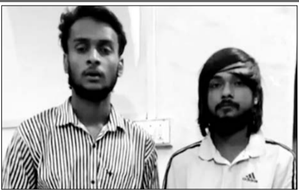
कार में आग लगाने वाले दो आरोपियों को पुलिस ने गिरफ्तार किया।