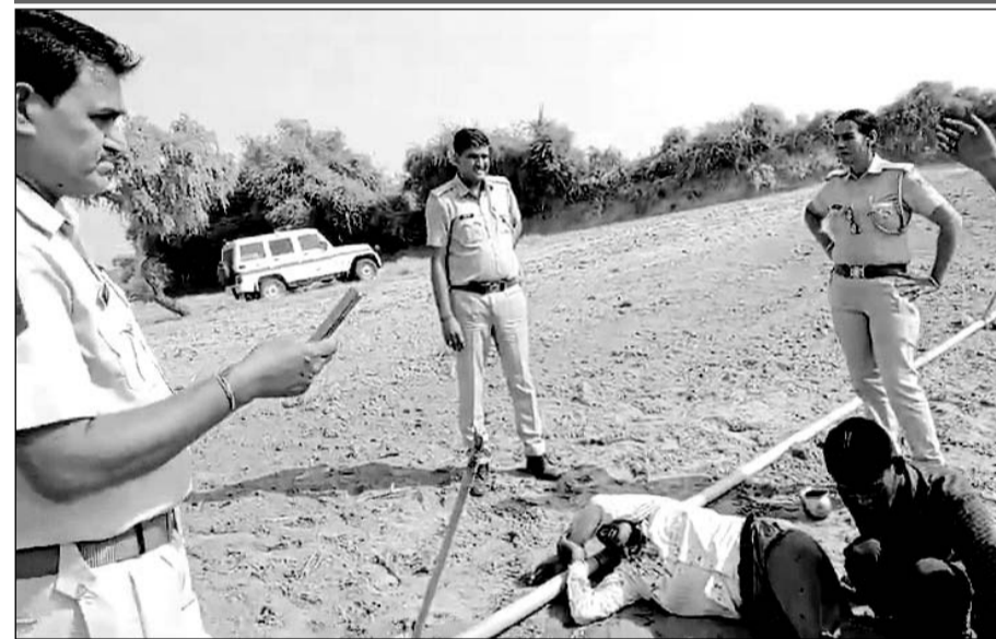
घटनास्थल का वीडियो सामने आया है, जिसमें खेत में एक व्यक्ति अचेत अवस्था पड़ा दिखाई दे रहा है।

गंभीर घायल को सूरजगढ़ के सरकारी अस्पताल में भर्ती करवाया, एक झुंझुं रेफर